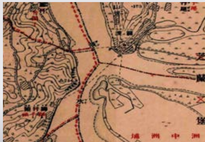
● 1904 年的關渡門渡航線

臺北盆地群山聳峙，沼澤遍布，交通困難，然而早期淡水河河床甚深，船筏可自淡水河口經關渡，溯河直至大溪、新店、汐止等地，沿河出現許多河港市鎮，形成綿密水運交