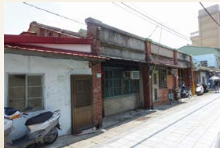
● 關渡老街旁的店屋

從前關渡老街最繁榮的地方，是靠淡水河、關渡宮一帶，這裡有十幾家大型的碾米廠和店鋪。從昔日的渡般頭上岸，在經過了關渡宮後的中北（腹）街，過了現在的關渡醫院即為店仔口，而店仔尾是距離碼頭店鋪最遠的地方，也是關渡街的最尾端。關渡街道的發展，在民國53年關渡隘口拓，渡船頭和鄰近的塹底（山後）一同成為淡水河床。如今，我們步出關渡站，進入