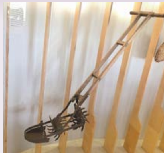
● 鐵器木器：攄草機 蔡財林贈 關渡人文館