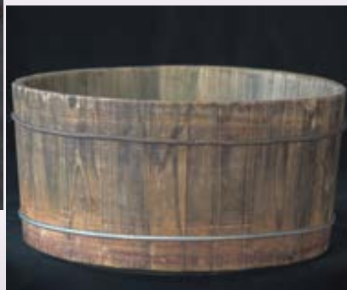
●木器：秧船 蔡財林贈 關渡人文館

在插秧的作業當中，盛裝秧苗的「秧披仔」，直接置放到「秧船」之上。同時「秧披仔」並備有繩索，讓數