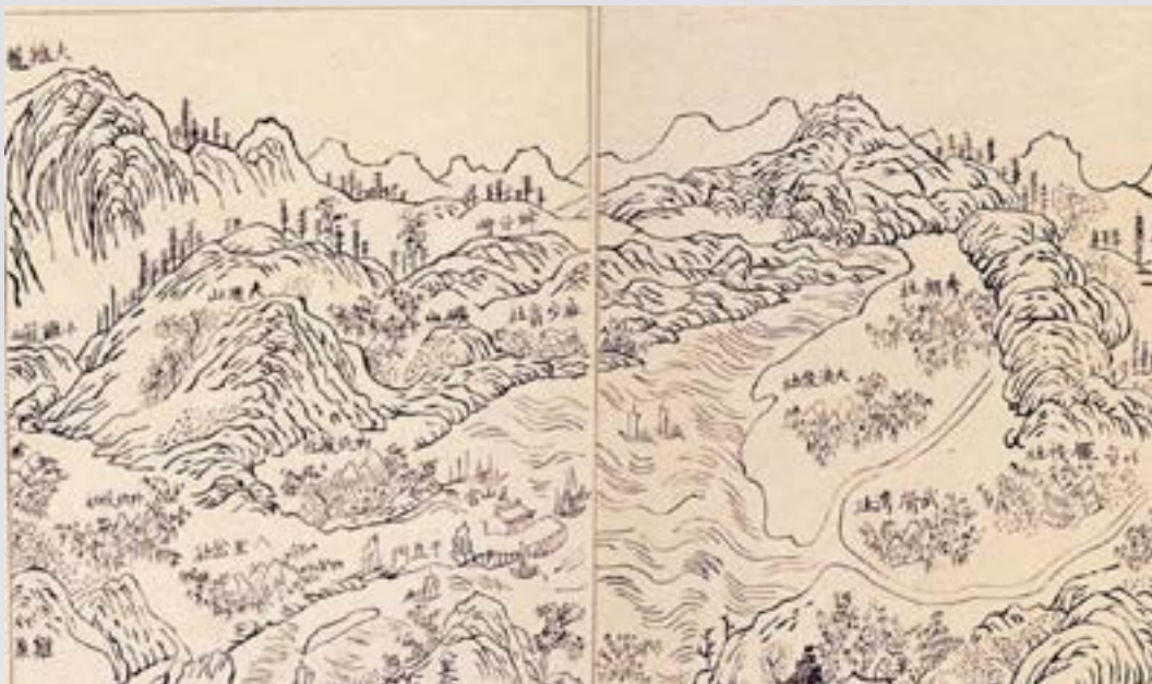
● 《諸羅縣志》附圖中的台北湖

通網與社會經濟共同圈，乃具有發展潛力的空間舞台。其中新莊首先發展為市面繁榮之市鎮。乾隆十一年至五十五（1746-1790）年新莊市況達於極盛，為盆地的行政和商業中心。乾隆十一年，八里坌巡檢並改駐新莊。其後，淡水河河道日淺，新莊港亦難以通航，商業又轉至艋舺。關渡因是唯一的共同出海口，因此水漲船高，成為北臺灣最早的聚落，而中北部最早的媽祖廟亦建於此。