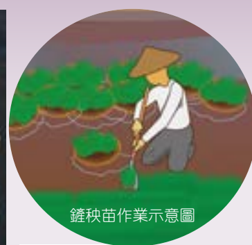
鏟秧苗作業示意圖

當進行插秧作業之前，先到苗圃將秧苗鏟起，然後依序放到秧籃之內，為因應當天插秧工作量所需，會事先準備數量適當的秧籃。盛放所有鏟起的秧苗之後，再運到田中進行作業，因此插秧時可以見到，許多盛滿秧苗、疊放整齊的「秧披仔」。