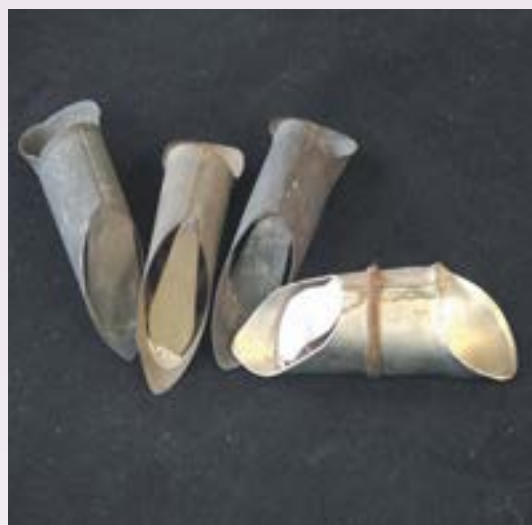
● 金工：播田管 蔡財林贈 關渡人文館

有關「播田管」，常與「秧船」、「秧披仔」搭配，在插秧作業時，先將「播田管」套在大拇指，然後取出一株秧苗，順手直接插入水田，並藉由尖鋤底而能夠更深入土中。同時也因為金屬圓管的保護，而讓長時間在田中插秧的農夫，免於作業時拇指受到傷害。