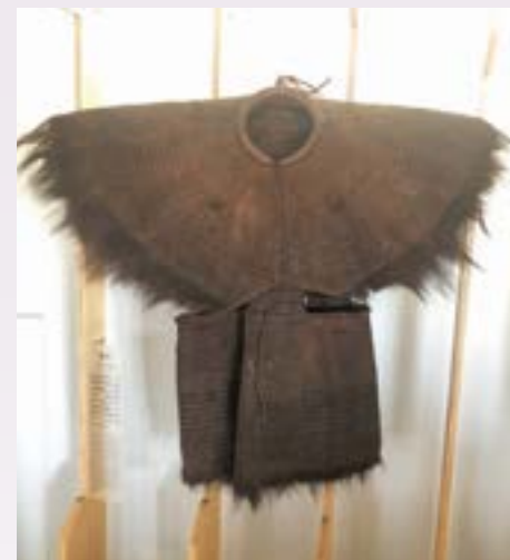
● 纖維編織：棕蓑 蔡財林贈 關渡人文館