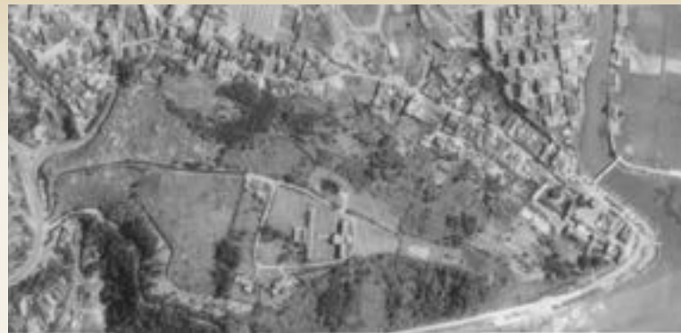
● 1974年的關渡宮與關渡老街

山上蓋一茅草屋，奉祀媽祖，採礦者每先至此燒香祈福一番，再往磺溪採礦。漸漸地，也開始在此墾拓，他們主要來自泉州、漳州二地。此後淡水河的水位逐漸降低，媽祖廟和住家也隨之往下移建。大約一百多年前，干豆門一帶海水退了，浮現一片肥沃的關渡平原，於是山坡上的居民，在平原有沃田可耕，在淡水河又有魚蝦可撈。船隻從海外到艋舺，必經此處。關渡宮廟口更形成一個貨物集散地，商店林立，市井繁盛，菜販、生意人、香客、行旅……往來頻繁，干豆曾盛極一時。