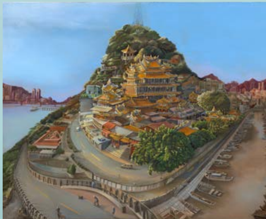
題目 / 靈山之境 作者 / 林亞岑 學校 / 國立臺灣藝術大學當代視覺文化與實踐研究所