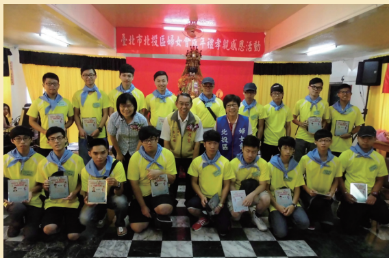
▲ 黃董事長與禮生合影

行感恩禮時，禮生跪向父母奉茶，許多父母熱淚盈眶，因為之前子女未曾向他們奉茶；家長為禮生授巾及加冠後，不自禁地親子深深擁抱，場面感人，親子之間的代溝瞬間消融。