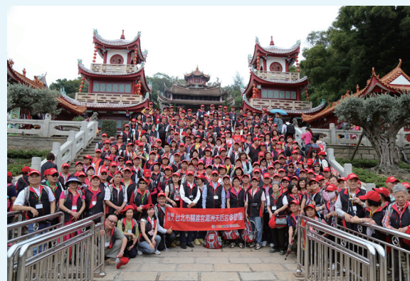
▲ 參加湄洲天后宮參訪信眾合影

本次參訪，許多團員感冒、咳嗽，幸蒙關渡醫院再次支援兩位護理師隨團照料身體不適團員，大家都感到很溫馨。