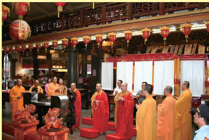
▲ 梁皇寶懺法會師父誦經祈福

梁皇寶懺共有十卷，為佛教中懺悔滅罪之懺王，亦是經懺中生亡兩利之寶典。如懺文所載：「以此消災，災消吉至，因茲滅罪，罪滅福生，真救病之良藥，乃破暗之明燈，恩沾九有，德被四方。」