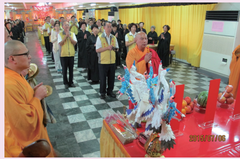
▲ 盂蘭盆法會師父誦經祈福